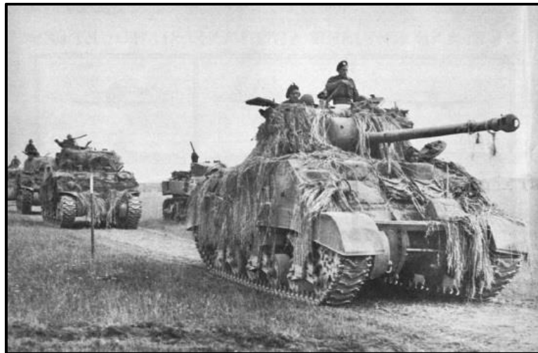
"Sherman Firefly" tank