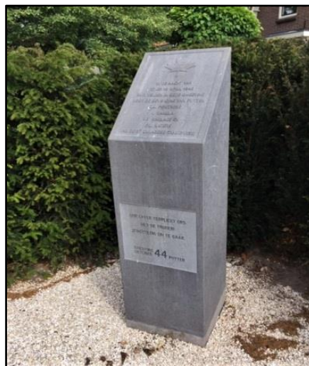
Monument slachtoffers gevechten 17 en 18 april 1945